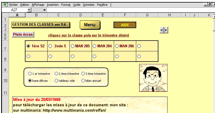
Figure 1 - Menu général

L'auteur, Laurent Delaveau, précise : « Le document Excel 97 que je vous propose permet de gérer les moyennes de 12 classes (par fichier). Il est destiné aux profs de collèges ou lycées. Au départ, ce document était une simple feuille de calcul comme beaucoup en ont. Petit à petit, cette feuille a évolué. Désormais, on peut dire que c'est quasiment un programme... ». Tout a été conçu pour que le logiciel soit le plus intuitif et le plus simple possible. Quand on ouvre le document Moyennes.xls , on découvre un menu avec toutes les explications nécessaires (Figures 1, 2 et 3). On saisit la liste de ses classes, on clique sur un bouton.